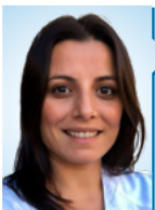
Maravillas Abia Serrano Servicio de Oftalmología, Unidad de Órbita y Oculoplastia, Hospital Universitari de Bellvitge. L'Hospitalet de Llobregat, Barcelona